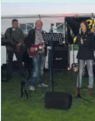
old man group