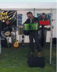
old man group