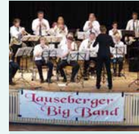
Lauseberger Big Band