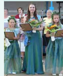
Nixe Rhuma mit ihren Elfen