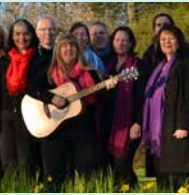
Lights of Gospel