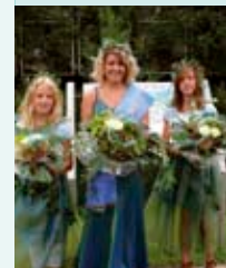
Nixe Rhuma mit ihren Elfen