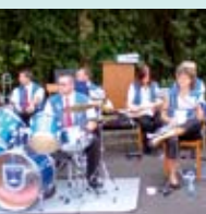
Fanfarenzug St. Sebastian Rhumspringe